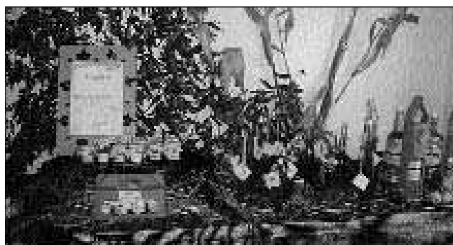
Ekološki pridelki in izdelki s certifikatom

To je uradni dokument, ki ga izda kontrolna organizacija.