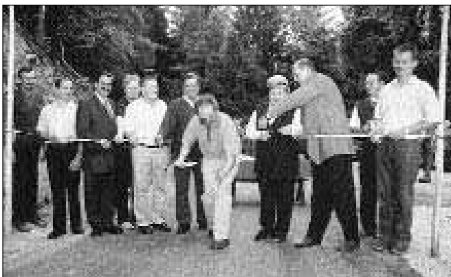
Otvoritev lokalne ceste Planica-Loka, odsek Kobalej-Cveček

Ker je država za ta namen tudi letos (in bo tudi prihodnje leto) zagotovila del sredstev, smo investicijo na tej cesti letos nadaljevali, prav tako jo bomo še v naslednjem letu. Seveda država dodeljuje sredstva samo pod pogojem obvezne finančne udeležbe občine in urejene projektne dokumentacije.