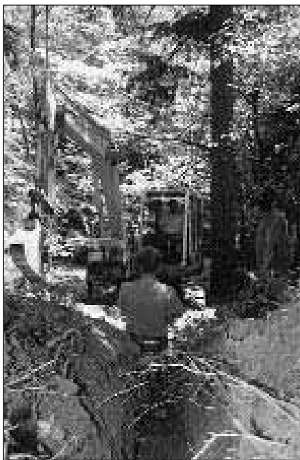
Ena izmed prioritov v naši občini je nadaljevanje izgradnje kanalizacije

Tudi krajanje Frama in Morja, kjer je letos in prejšnja leta potekala investicija izgradnje kanalizacije, smo v mesecu juniju 2003 pozvali, da pristopijo k podpisu pogodbe za priklop na javno kanalizacijsko omrežje. Čeprav lahko rečemo, da je bil odziv za podpis pogodb velik, na podpise nekaj posameznikov še vedno čakamo, zato jih - enako kot sem navedel že v primeru krajanov Rač, živčih v predelu Ceste talcev in Poljske ceste - znova pozivamo, da pristopijo k podpisu pogodbe najkasneje do konca tega leta, saj bo v nasprotnem treba poravnati strošek prispevka za izgradnjo kanalizacije v enkratnem znesku, povečanem za 15 % vrednosti.