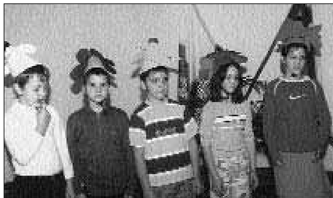
Nastopajoči učenci OŠ Fram

Kot uvod v predstavitev najlepših fotografij in slovesno podelitev priznanj in plaket so člani Komisije oz. Odbora za izvajanje projekta »Moja dežela - lepa in gostoljubna« zapisali: