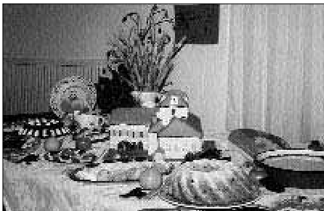
Nekaj izmed obilice dobrot, ki so jih pripravile turistične kmetije in pridne roke članic Društva podeželskih žena "Klasje" Rače

Pa se vrnimo k rožam. Slednje vzgajamo z veliko ljubeznijo in z mnogo truda. Ko pa se bohotijo, nas navdajajo s srečo. Ljubezen in srečo pa so s svojim nastopom delili tudi učenci 3. razreda devetletke iz Osnovne šole Fram, ki so jim s pesmijo sledili pevci moškega pevskega zbora Obrtnik Slovenska Bistrica - Polskava.