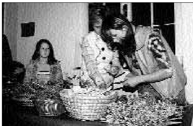
Utrinki delovnega vzdušja - priprava razstave (Turistično društvo Fram)

Na prijeten petkov večer, 7.11.2003, smo na slovesni podelitvi priznanj in plaket za najlepše urejene poslovne objekte, kmečka dvorišča, ulice, vasi in stanovanjske hiše še enkrat ujeli barvitost letošnjega cvetja. Prireditve smo združili s predstavitvijo domačnosti, lepote krajev naše občine, tipičnih pohorskih kulinarčnih dobrot ter dobrot za sladokusce, ki je prav tako potekala v grajskih prostorih in je bila vsekakor vredna ogleda. To razstavo cvetja, vina, kulinarčnih dobrot in turistične ponudbe našega kraja smo pripravili skupaj z vrtnarji, turističnimi kmetijami, članicami Društva podeželskih žena Klasje - Rače in Turističnim društvom Fram.