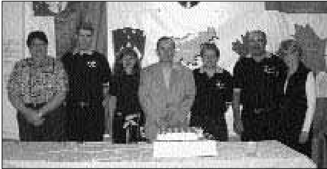
Člani odbora Slovensko kanadskega združenja (in torta ob obletnici)