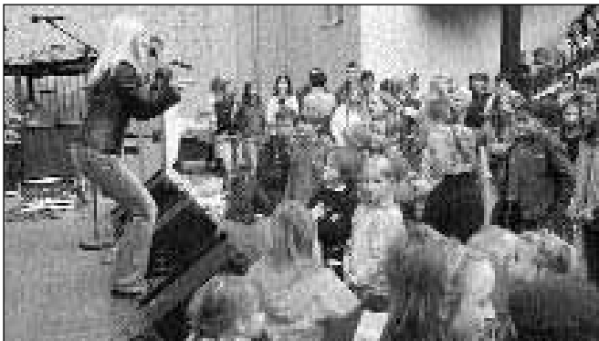
Rajanju ni in ni hotelo biti konca...

Skupaj smo iskali skriti zaklad, uživali v ustvarjalnih delavnicah, jedli kostanje in se ob 50. rojstnem dnevu mariborske ZPM sladkali s torto velikanko. Najmlajšim so se zasvetile oči, ko so zagledali na novo postavljeno igralo ob domu, tisti, ki se že preizkušajo v športnih vrstah ali pa jih plezanje zgolj zanima, pa so se lahko preizkusili tudi na novi plezalni steni. Skratka, zabavno je bilo. Tistega dne pa je sonce še posebej zasijalo in pomežiknilo petdesetim belomodrim balonom, ki so v nebo ponesli želje otrok. Upajmo, da so pristali tam, kjer bodo te misli in želje ne le prebrali, ampak tudi po svojih močeh pripomogli k njihovim uresničitvam.