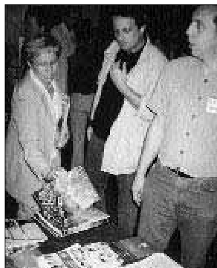
Z mize, kamor smo udeleženci SLČS nastavili glasila za medsebojno izmenjavo, so Novice Obcine Rače-Fram hitro pošle