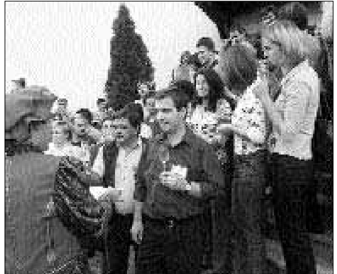
Udeleženci 7. SLČS na degustaciji vin Steyer - pred gradom Vrbovec • foto: fotogalerija Savinjskih novic

Letošnji organizatorji si vsekakor zaslužijo pohvalo, ker so bile izbrane teme kratko predstavljene in je bilo veliko možnosti za razprave ter za kakovostno izpeljan družabni del srečanja z ogledom Muzeja gozdarstva in lesarstva v Nazarjah, v neposredni bližini predavalnice, ter nogometno tekmo med »piarovci« in »lokalci«.