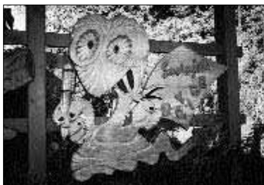
Simpatičen znak gostitelja letošnjega srečanja SLČS - Savinjskih novic