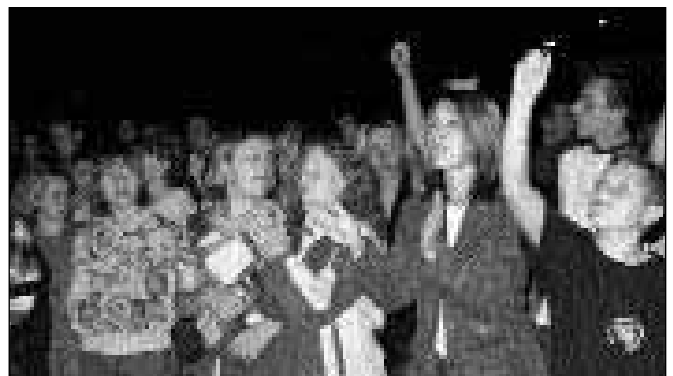
Na RačeFestu se je zbralo predvsem veliko mladih

Kot kaže, se je ta razdelitev na tri odre dobro obnesla, kar so povedali tudi nastopajoči sami. Mislim, da to ni razbilo festivala, ampak kvečjemu postavilo vse na svoje mesto, kamor sodi. Tudi poslušalci so lažje izbirali, kaj bodo poslušali. Tako da bomo tudi v prihodnje obdržali podobno razdelitev.