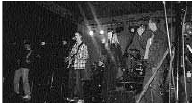
Domača skupina Svetnik