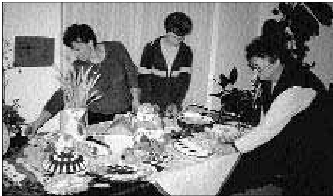
Zadnje priprave...

Enako je bilo letos in kmalu po povabilu so zazvonili telefoni, članice društva smo se poklicale in dogovorile glede peke peciva. Rezultati so se odrazili na razstavi peciva v občinskih prostorih. Seveda so imeli svoj prostor tudi cvetličarji, kmečki turizmi in turistično društvo. V medsebojnem sodelovanju smo pripravili razstavo, ki je bila na ogled še naslednji dan, ko je bilo na grajskem dvorišču martinovanje. Tako si je razstavo lahko ogledalo precej ljudi in veseli smo, da je bilo tako.