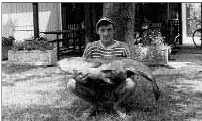
Včasih zagradi tudi tako velika riba...

Ribolovna sezona v ribnikih Rače se prične 1. marca in konča 31. oktobra.