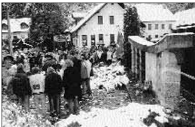
Žalna svečanost pred dnevom mrtvih v Framu

Ob krajevnem prazniku, 24. septembru, se vsako leto poklonimo žrtvam NOB na Jugovem v Rančah. Tam sodelujemo s Krajevno skupnostjo Slivnica, organizacija pogostitve pa je domena Društva krajanov Ranče.