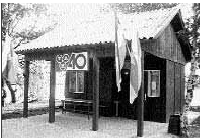
Izglede prvega, najstarejšega doma

Leta 1991 smo začeli intenzivno gojiti krpa mladico. Uspeh je bil dober, saj smo vzgojili 48.000 mladice krpa. Naše delo je postalo še uspešnejše, ko smo podpisali sodelovanje s področja vzreje rib s firmo »Ribe Maribor«.