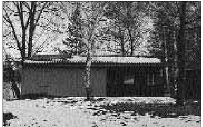
Takšen je ribiški dom v Račah od leta 1989 in vse do danes

Med Petrolom in Tekolom stoji danes v lepem okolju, za katerega redno skrbimo, lep ribiški dom, ob njem pa trije ribniki, polni rib. Največji in srednji ribnik sta namenjena športnemu ribolovu, tretji - najmanjši pa vzreji rib.