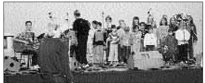
Posneto tik pred izvedbo prve pesmi, ko se zdi, da je tu in tam vendarle koga malo zagrabila trema...