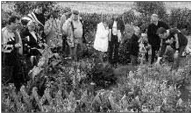
Ogled zeliš-nega vrta

Na dan odprtih vrat so lahko obiskovalci ekološko kmetijo obiskali med 10.00 in 16.00 uro. Tedaj so spoznali kmetijo Uranjek, se seznanili z osnovami ekološkega kmetovanja, spoznali, kako so takšne kmetije nadzorovane, kako kupcu zagotavljajo, da je hrana res pridelana na ekološki način. Ogledali so si zelišča na kmetiji, se seznanili, kaj je Pohorje Beef, kako od jabolke do jabolčnika ali jabolčnega soka, del predstavitve pa je bilo namenjene tudi trženju turizma (prodaja na krožniku). Ogledali so si lahko tudi hlev na prosto rejo, travniški nasad in prikaz kuhanja žganja na tradicionalni način.