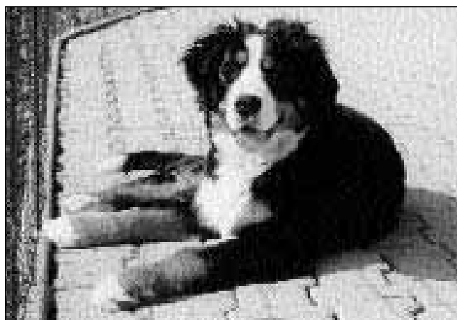
Lep primerek štirino`nega -lovekovega prijatelja

Pes sodi med duševno eno izmet najvišje razvitih živali. Vemo tudi, da so se psi velikokrat podali v nevarnost in tako rešili življenje svojega gospodarja.