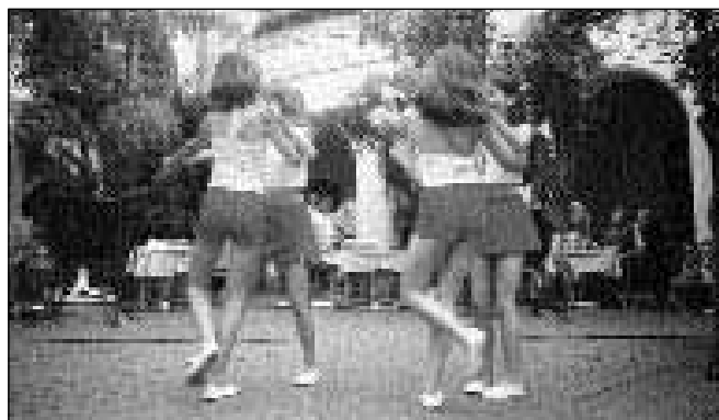
Utrinki z naših nastopov