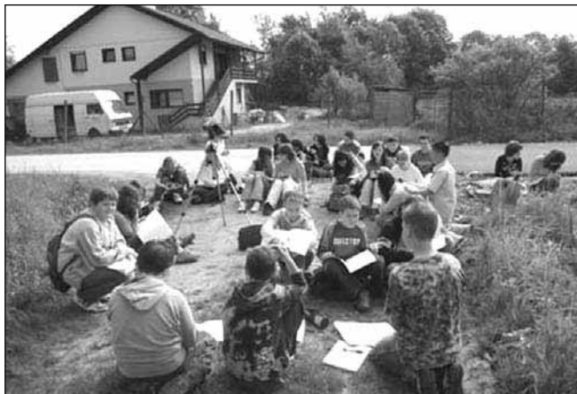
Učenci raziskujejo svoje okolje

Dejavnost na šoli bomo tako kot doslej popestrili s sodelovanjem na raznih natečajih in projektih, ki jih razpisujejo zavodi ali delovne organizacije. Tako smo se do sedaj že prijavili k sodelovanju v dveh projektih in enem natečaju: