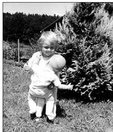
Teja ima otroke rada že od malih nog; sedaj v njih vidi bodočnost - zasebno in poklicno

Želim študirati specialno in rehabilitacijsko pedagogiko, znano bolj kot defektologija, smer logopedinja. Pravzaprav ne vem točno, zakaj, ampak preprosto se želim ukvarjati z otroki in jim pomagati. Če pa mi ne uspe priti na to fakulteto, pa bom študirala razredni pouk. Ja, življenja brez otrok si ne znam predstavljati!