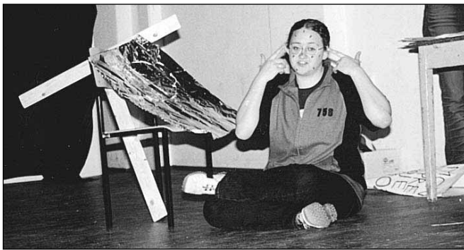
13. april 2002 in Teja, tedaj učenka 8. razreda, kot glavna junakinja šolske predstave Aknožer

Kot že rečeno, najraje pojem. Sedaj to počnem v dveh vokalnih skupinah (A Cappella in Škrjanček), učim se tudi solo petja.