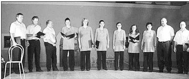
Vokalna skupina Škrjanček na enem izmed številnih nastopov; Teja je peta z leve

Kot že rečeno, najraje pojem. Sedaj to počnem v dveh vokalnih skupinah (A Cappella in Škrjanček), učim se tudi solo petja.