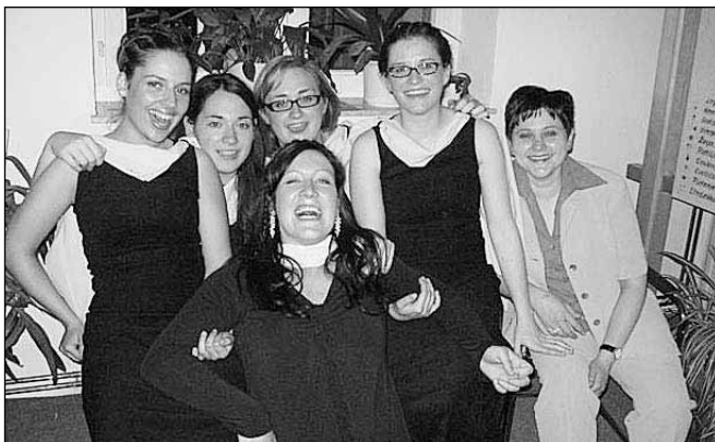
Vesele, da je nastopa konec (s kolegicami - pevkami vokalne skupine A Cappella)

Ukvarjam pa se še z IMPRO gledališčem. Na naši šoli imamo ekipo, v kateri tekmujem že četrto leto. IMPRO gledališče je gledališče, v katerem se vse improvizira in se ne ve nič naprej. Obstajajo discipline, igre, ki imajo pravila. Te mi, improvizatorji, poznamo, potem pa nam občinstvo določi, kaj je potrebno igrati in mi zaigramo na najbolj izviren način. Moram reči, da mi je to zelo pomagalo tudi v vsakdanjem življenju, kajti sedaj mi je lažje hitro odreagirati v dani situaciji. Ta tekmovanja so zelo zanimiva, ker vedno doživiš nekaj novega in če imaš dober dan, pridejo iz tebe take pozitivne in zanimive stvari, da še sam sebe presenetiš!