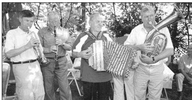
Del muzikantov - čebelarjev treh občin

V pripravi imamo načrte za čebelarski muzej, saj ga na Dravskem polju ni. Precej materiala že imamo in ga tudi še zbiramo, prav tako finance. Čebelarska zveza Zgornja Gorenjska je izdala zloženko "Čebelji pridelki, moč narave". Naši člani jo bodo brezplačno podelili sosedom, znancem, prijateljem, nekaj jih dobijo tudi učenci osnovnih šol ter zdravstveni domovi v občinah Rače - Fram, Hoče in Starše, katerih krajanji so naši čebelarji.