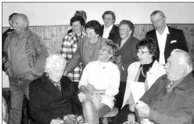
Po prireditvi smo vsi srčno peli