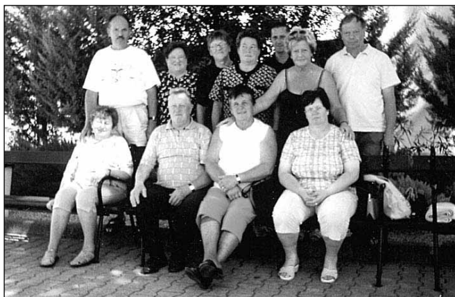
Spominski posnetek vseh udeležencev - krvodajalcev OO RK Fram v Punatu; naše druženje je bilo prijetno, zabavno, na trenutke pa tudi naporno

Tretji dan ekskurzije smo se peljali z ladjo v mesto Punat. Mesto je zanimivo, čisto in prijetno urejeno, ni pa nam naklonilo prav lepega vremena. Ob vračanju se je namreč morje razjezilo in nas tu in tam precej poškopilo, zaradi česar smo se ob izkrcanju počutili konkretno mokri.