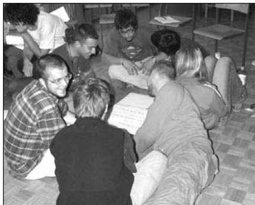
Mladi potrebujejo kakovostno obliko druženja in preživljanja prostega časa

Kletne župnijske prostore smo s prostovoljnim delom in prostovoljnimi prispevki vseh, ki čutijo potrebo po tovrstnem centru, obnovili in jih napravili prav prijetne. Sedaj pa začenjam proces, ko bomo tem prostorom vdihnili življenje. To pa je mogoče seveda le z mladimi soustvarjalci.