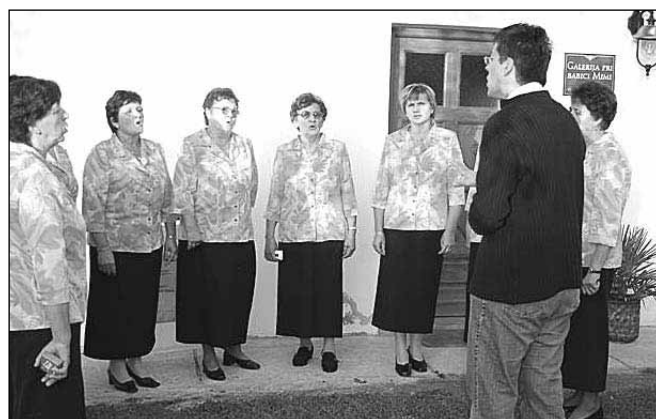
Ljudske pevke "Klasje" na enem izmed nastopov