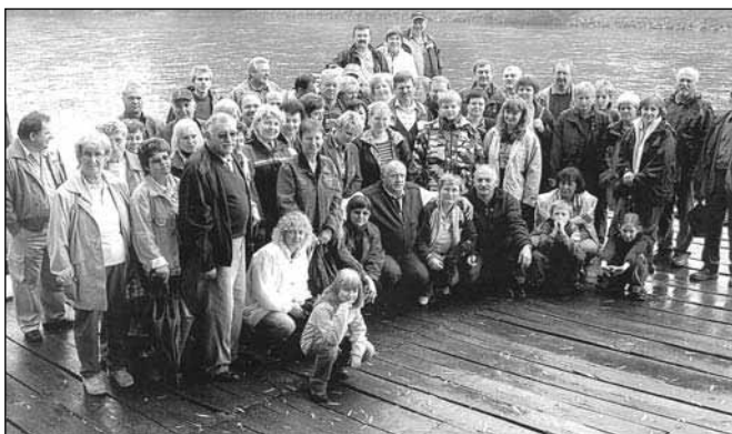
Skupinski posnetek - splav na reki Muri

Po fazanih smo se odpravili naprej do reke Mure. Vsi smo že slišali za slavni "mlin na Muri" in resnično je vreden ogleda. Žal pa nam je dež pokvaril ogled mlina v celoti.