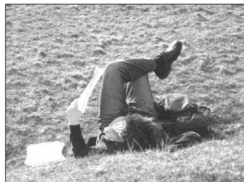
Pozimi bomo aktivni v zaprtih prostorih, spomladi pa bo znova prišlo v poštev tudi ležanje, pogovarjanje in učenje na travi

Lepo vabljeni vsi mladi, ki želite v ustvarjalnem druženju in ustvarjanju preživljati svoj prosti čas.