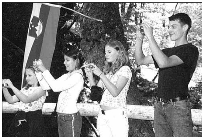
Dogodek so pridno fotografirali tudi naši najmlajši domači fotografi