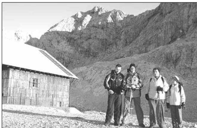
Slovo od očaka v čudovitem jutru

Sestop se je začel po isti poti kot je potekalo vzpenjanje, le da seveda v obratni smeri - navpično navzdol. Bila sem zelo srečna, da sem na vrhu objela in delila čudovite občutke s svojim desetletnim vnukom. Upam, da sem tudi njemu vcepila občutek doslej neznane lepote in veselja do naših čudovitih gora. Upam, da bo nadaljeval moje sanje.