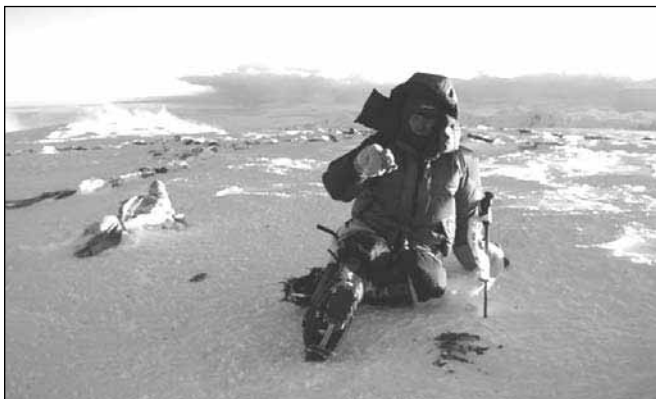
Vrh Cho Oyu

Jasno je, da je vsak dan bolj mrzlo in vse bolj vetrovno. Približuje se zima. Dušanu in Damijanu nekako uspe najti zlato luknjo v vremenu in 8. oktobra 2006 ob 16.25 uri osvojita vrh Cho Oya.