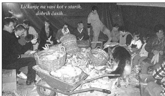
Ličkanje na vasi kot v starih, dobrih časih...