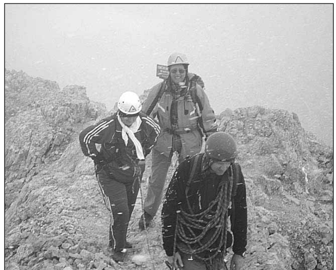
V snežnem metežu se počasi prebijamo proti vrhu