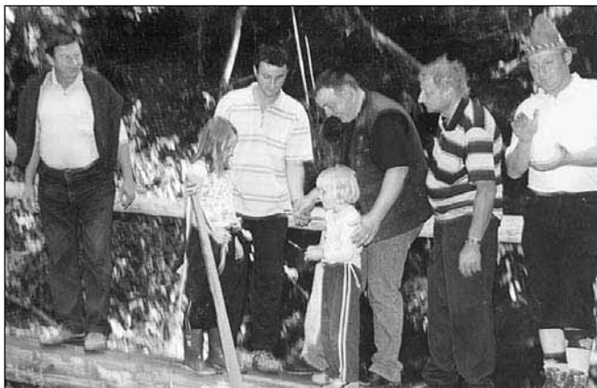
Deklici, obe Anji (Lorenčeva in Freglova po domače, kakor smo navajeni imenovati bližnji kmetiji na obeh straneh), sta prerezali trak in tako simbolično združili krajane obeh zaselkov

Opravljenemu delu smo proslavili s prijetnim druženjem. Naj o tem več "spregovorijo" fotografije.