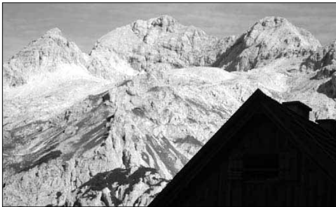
Pogled proti Triglavu - tako blizu, a vendar še tako daleč