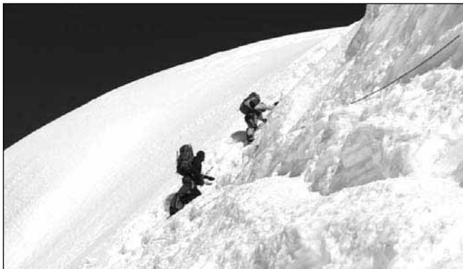
Plezanje na Cho Oyu

tako zelo nizkega zračnega pritiska. Držim pesti zanju in ju bodrim po nam edini vezi - prenosni postaji. Večina odprav je iz baznega tabora že odšla, ostale smo še samo štiri manjše odprave, in pri drugih poskušam preveriti vremensko napoved.