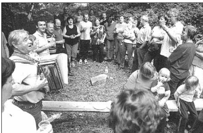
Po uradnem delu so gospodinjice iz obeh zaselkov pripravile pogostitev, vinogradniki pa so prinesli svojo dobro kapljico, tako da se je veselo jedlo, pilo in tudi pelo

Po okrepcilu smo obujali spomine na nekdanje življenje ob našem potočku. čeprav ozek in kratek - v dobri uri pridemo od izvira do izliva - je poganjal trinajst mlinov in osem žag. Preko njega so vodile uhojene poti, ki jih zdaj vedno bolj uporabljajo izletniki.