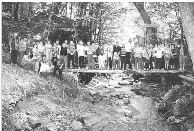
Po odprtju smo preizkusili, ali je kaj trden most, in ugotovili, da kakor kamen, kost