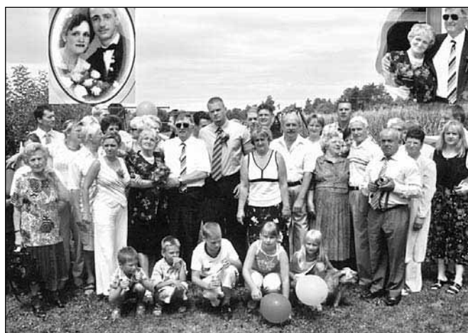
Zlatoporočenca Ploj v krogu družine in prijateljev

Rad te imam - pa ne toliko zaradi tega, kar si, ampak zaradi tega, kar sem jaz, kadar sem s teboj.