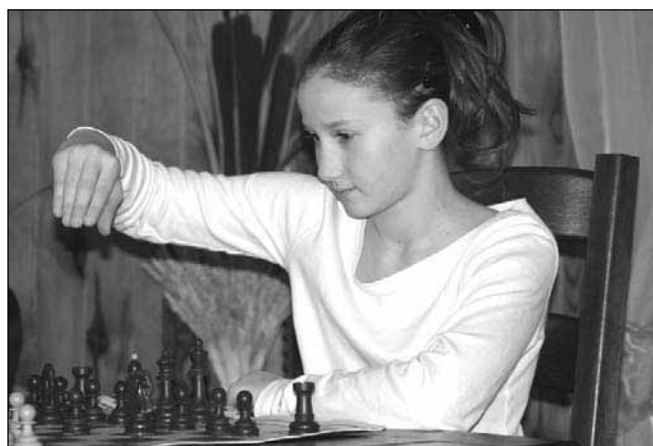
Odločitev je padla