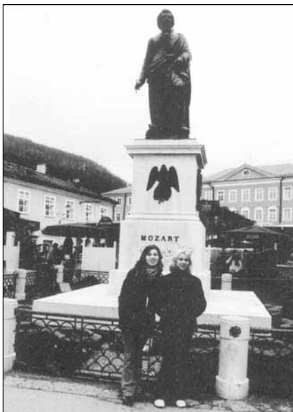
Salzburg v Mozartovem letu 2006 - spominska fotografija ob spomeniku glasbenega genija; 9.12.2006