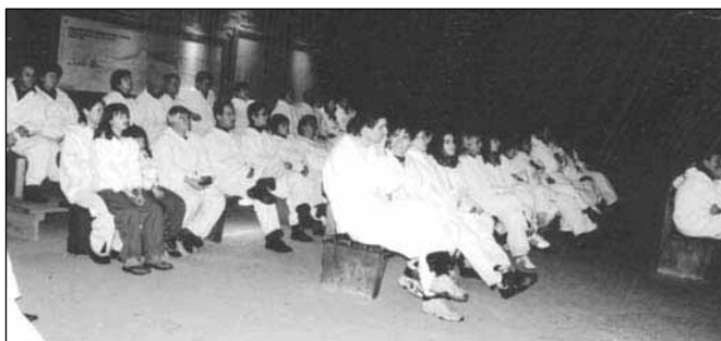
Predavanje v rudniku soli v Dürnbergu

Iz najgloblje točke (okoli 180 metrov) se nato vrnemo po pomičnih stopnicah do jamske železnice, ki nas ponovno pripelje "na svetlo". Slečemo bela oblačila, ki smo si jih nadeli že ob prihodu. Za spomin lahko kupimo fotografijo (med potjo nas je kamera večkrat posnela) ali pa kakšen spominek v tovrstni prodajalni pri vhodu.