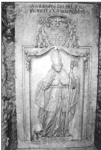
Sveti Rupert - zaščitnik rudnika soli v Dürnbergu