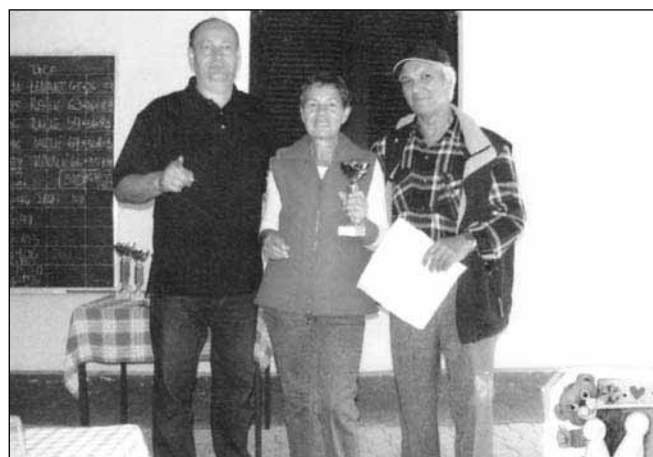
Praznik KS Fram, september 2006 - Srečanja, na katerem smo podelili zaslužene pokale zmagovalnim ekipam, se je udeležil tudi naš župan

Ob koncu pohvala in zahvala vsem, ki so opravili dobro delo, vsem ostalim članom društva pa velja povabilo, da se kegljišča pridno poslužujete, saj je namenjeno rekreaciji in koristnemu preživljanju prostega časa naše generacije.