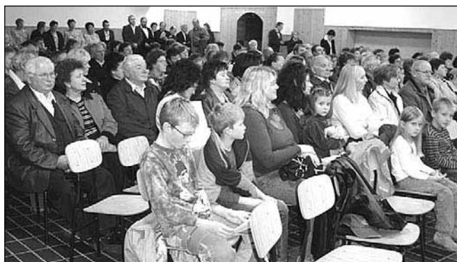
Koncert ob 15. obletnici delovanja Karitas Rače

Večer smo zaključili z majhno pogostitvijo, pri kateri je sodelovalo mnogo gospodinj in vinogradnikov. In s pomočjo obiskovalcev se je v blagajno zopet nateklo kar precej tedanjih tolarjev.