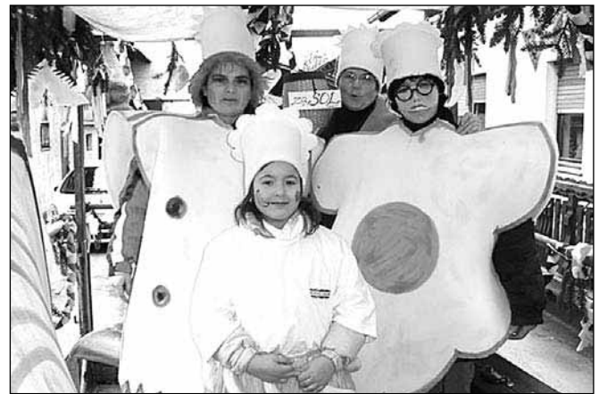
Sodelovale smo v letošnji pustni povorki

Po daljšem premoru se ponovno oglašamo v občinskih Novicah, da občanom predstavimo naše aktivnosti.