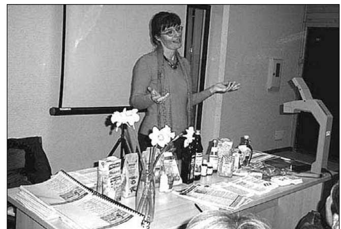
Eno izmed poučnih predavanj