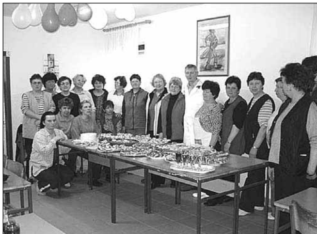
Podeželske žene posvečamo veliko pozornosti tudi kulinariki; pladnji, obloženi s kanapeji različnih vrst, mamljivo vabijo

Naj pisni del prispevka začnem še z lanskim letom, ko smo se odpravile v sosednjo Avstrijo na ogled razstave na prostem, na temo "Buče". Buče so vedno pogosteje prisotne v naši vsakdanji prehrani in sicer na najrazličnejše načine, tudi kot sladica. Za oči pa so bile prava poslastica najrazličnejše oblike in barve buč. Avtorji razstave imajo bogato domišljijo in izkušnje.