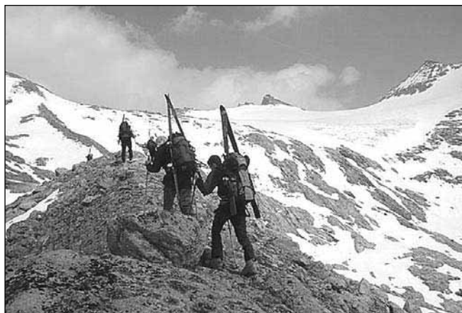
Med vzponom na Sonnblick

Ker zima ni bila tako radodarna s snežnimi padavinami kot leto nazaj, smo se morali krepko potruditi, da smo našli nekaj snega. Zato smo se povzpeli tudi na nekaj tritisočakov v sosednji Avstriji in celo uživali v turnem smučanju.