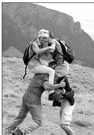
Poletje nudi idealno priložnost za planinske radosti