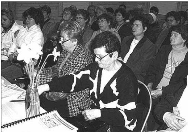
Naše članice na predavanju