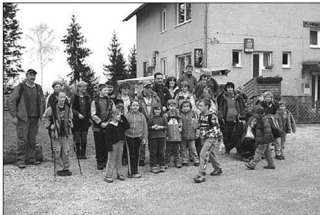
Tudi vi vabljeni na Tojzlov vrh!

Mirno lahko zapišem, da za člane planinskega društva ni zimskega spanja in počitka, niti spomladanske utrujenosti. Program izletov je sestavljen tako, da akcije potekajo skozi vse leto, seveda pa so prilagojene letnemu času.