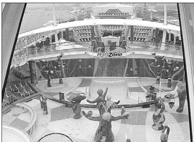
Delček bogate ponudbe Liberty of the seas

klase. Priznam, da me je Liberty of the seas v trenutku na nek poseben način prevzela. In to ne zgolj zaradi njene impozantnosti, ki jo navzven izkazuje s svojimi spoštljivimi 340 metri dolžine (to je štirikratna dolžina Titanika) in 56 metri širine. Tudi drugi podatki o njej so dih jemajoči: na 15 palubah sprejme 4328 potnikov in skoraj 1400 članov posadke. Tehta 154.417 ton. Ladja ima dva glavna propelerja, ki se lahko zavrtita za 360 stopinj, vsak od njiju pa ima 19.000 konjskih moči, stranski stabilizatorji in motorji pa po 7000 konjskih moči. Ladja razpolaga s 1817 kabinami, imenovanimi "staterooms", od tega jih ima kar 842 balkon. Ladja ponuja veliko inovacij v ladjarski industriji - od plezalne stene, ki je na višini 68 metrov nad morjem, igrišč za golf, tenis, košarko, boksarski ring, več bazenov in jacuzzijev... Največja novost pa so t. i. "flow rider" ali umetni valovi, ki omogočajo surfanje. Otroci bi rekli, da so v rajju, saj je za njih urejen velik otroški vodni park z bazeni, tobogani, vodnimi igračami... Skratka, za vsak dan križarjenja novo aktivno doživetje in počitek hkrati.