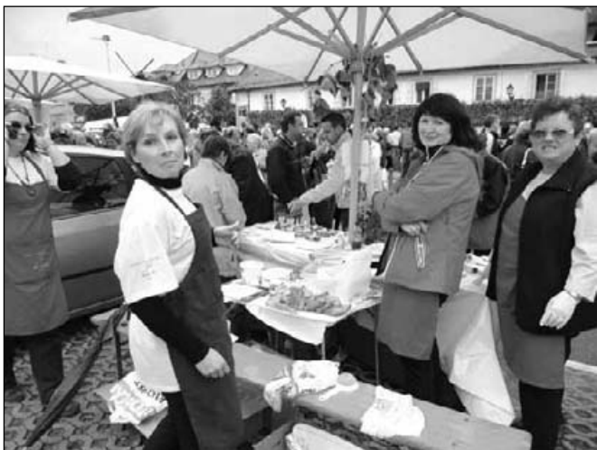
Ob naši stojnici