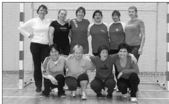
Veteranke RK Rače – Mladi upi

V klubu je, poleg navedenih, dejavna še skupina veterank, ki vadi ob sredah zvečer na 1/3 telovadnice. Naša najizkušenejša skupina se imenuje »Mladi upi«, saj nam ime »Veteranke« ne diši najbolj. Tako je v našem klubu poskrbljeno tudi za malo manj mlade rokometiške, vendar še polne moči, predvsem pa volje po gibanju in druženju.