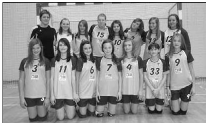
Mlajše deklice A