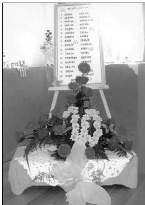
Ob cvetličnem aranžmaju in našem simbolu – metuljčku smo navedle tudi imena naših članic, ki v ročnodelskem krožku vztrajajo že 10 let

Letošnjo jubilejno razstavo smo pričele nekoliko drugače. Pripravile smo svečano otvoritev, popestreno s pesmimi, plesom in recitali. Na prireditve smo povabile preko trideset ročnodelskih društev in ponosne smo na rekorden obisk.