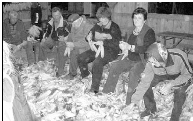
Oživelimo smo običaj kožuhanja

tako sklenili obuditi nekdanj pogost, danes pa tako rekoč že izumrl običaj na vasi, to je ličkanje koruze – t. i. kožuhanje. Čeprav smo bili sprva skeptični glede odziva, smo kasneje ugotovili, da je bila bojazen odveč – kožuhanje je namreč več kot uspelo in ob tem starem opravilu smo se počutili povezane in srečne, kot bi čas zavrteli nazaj, ko je bil človek človeku res človek, ko so sosedje in vaščani držali, dihali in delali skupaj.