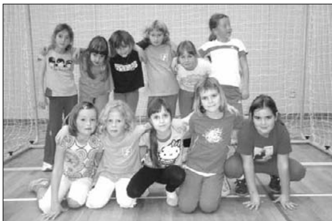
Mini rokomet letnik 2003 in 2004 (1. in 2. razred)

Ker rokomet uvrščamo med ekipne športe, ta pri otrocih vpliva tudi na socialni razvoj, saj so primorani upoštevati pravila iger, skozi katera prikažejo tudi svoje moralne odlike, kot so poštenost, pogum, odločnost. Hkrati pa se učijo prenašanja zmag in porazov, kar je v današnji mladi družbi še posebej dobrodošlo.