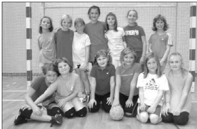
Mini rokomet letnik 2002 – 3. razred

Trenerji najmlajših vadbениh skupin se zavedamo, da imamo zelo zahtevno in odgovorno nalogo, saj se otroci med 6. in 10. letom starosti nahajajo v tako imenovanem »zlatem obdobju« motoričnega razvoja, kjer so najbolj dovzetni za osvajanje novih motoričnih elementov, pospešen je njihov fiziološki razvoj in vedno bolj se oblikujejo njihovi vrednostni sistemi ter sam odnos do športa.