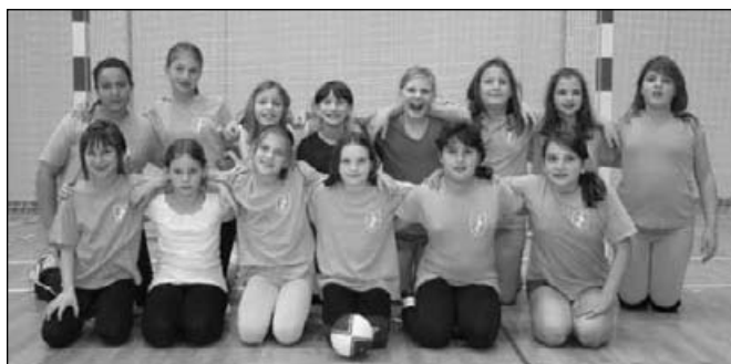
Mini rokomet 2000

V letošnjem šolskem letu smo z vadbo naših najmlajših skupin (cici in mini rokomet) pričeli v mesecu septembru. Oblikovali smo tri skupine mini rokometu v OŠ Rače in skupino v OŠ Starše, kjer vadijo deklice od letnika 2000 do letnika 2004.